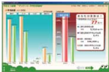
あなたの家庭は何位? CO 2 排出の平均比較